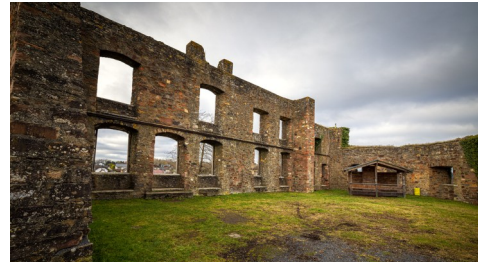
Die Oberburg von Ulmen