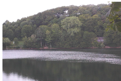
Das Ulmener Maar, etwa 10 000 Jahre alt

Jenseits der Autobahn liegt ein wassergefülltes Trockenmaar, der Jungferweiher. In dem Naturschutzgebiet sind eine Vielzahl von Vogelarten zu finden die sich rund um des See heimisch fühlen.