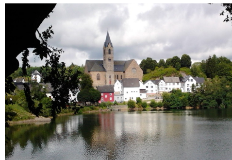
Die geschichtsträchtige Stadt Ulmen